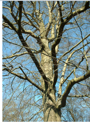
, 14 Maart 2003