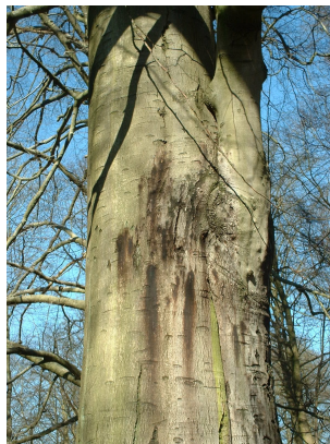
, 14 Maart 2003