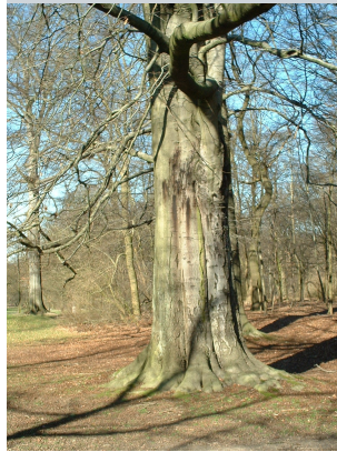
, 14 Maart 2003

* Deze criteria worden gewogen op de wijze als omschreven in de methodologie .